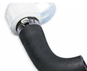
KIT DE RINCAGE BASIC € 22,00