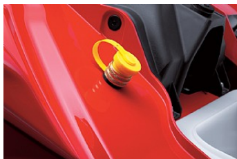
Bouchon de drainage