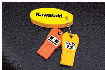
Kawasaki Smart Steering/Mode SLO