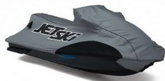
BACHE € 319,00