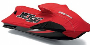
BACHE ULTRA250X € 279,00