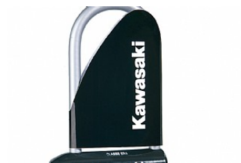
ANTIVOL U UNIVERSEL € 82,00